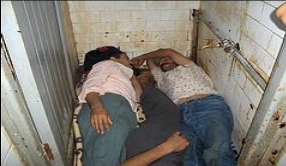
تصویری از زندان کهریزک